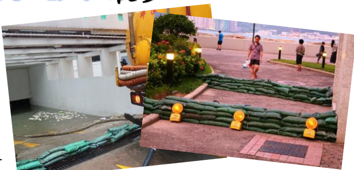
↑ 自2017年「天鴿」吹襲後，沒有實際有效的防風措施，直至2019年中才開始制定

我們多次向港鐵公司爭取削減保險費，終有成果。據管理處透露，保險公司同意減收2021年保險費最少10%。