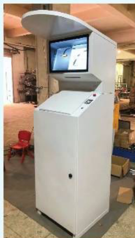
此為測試型號, 非最終版本。