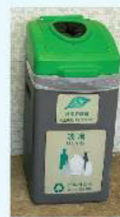
玻璃樽回收 第 2,9,16、21、28, 31,36,40, 43, 49座