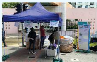
業委會 x 俊成環保 收膠街站 逢星期日 10:30-12:30 | 一粥麵外