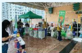
四月二十五日與環保署合辦 「乾淨回收資訊站」攤位遊戲