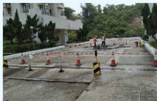
以機器打磨地面，增加地面防滑效能