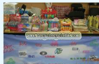
業委會 x 環保站 源頭分類綜合回收計劃 (以物易物) 逢每月第二個星期日 10:30-16:30 | 上杏圓環