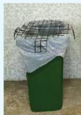
慳電膽及光管回收 第 2,9,36,38,43座