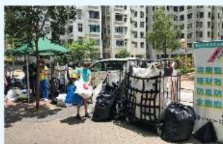
綠在東區 流動回收街站 逢每月第三個星期六 10:00-13:00 | 一粥麵外