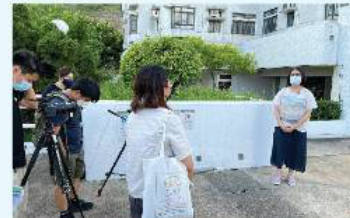
接受環保署訪問, 分享屋苑回收心得